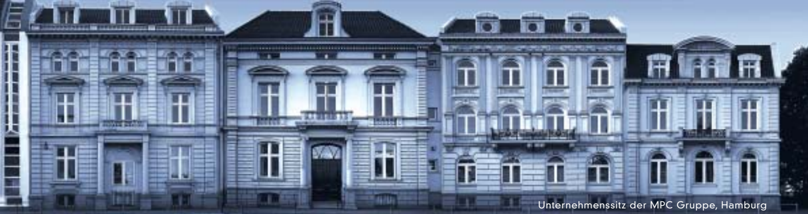
Unternehmenssitz der MPC Gruppe, Hamburg